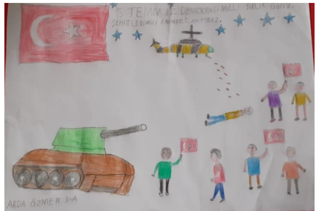
Arda ÖZMEN 3/A