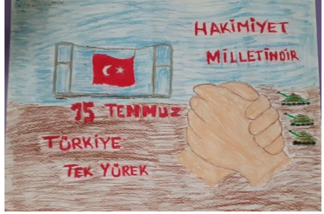
Fatma Zehra ÜSTÜN 3/A