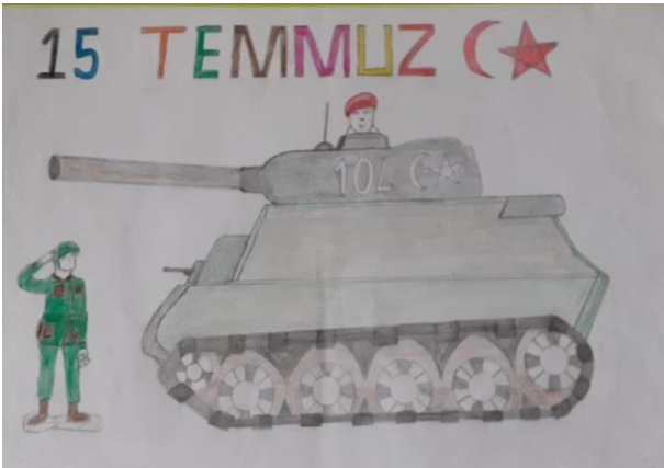
Muhammed Emir AK 2/A