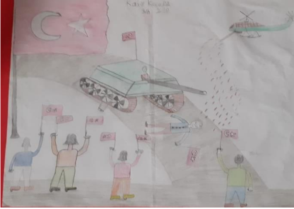
Kadir KOCADÜZ 3/A